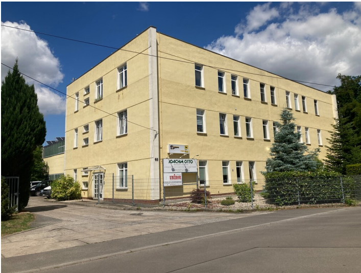
Blick auf die südwestliche Gebäudeecke