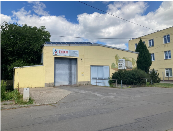
südliche Giebelseite des Mehrzweckgebäudes