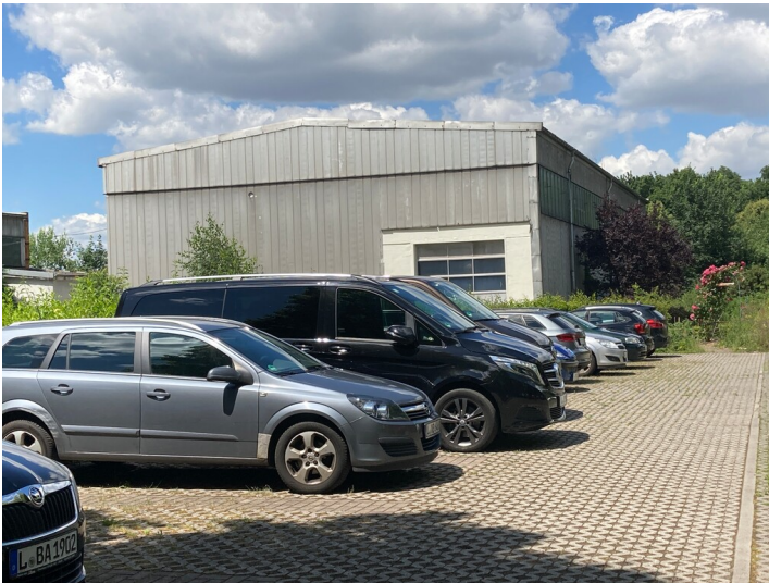
südliche Giebelseite der Mehrzweckhalle