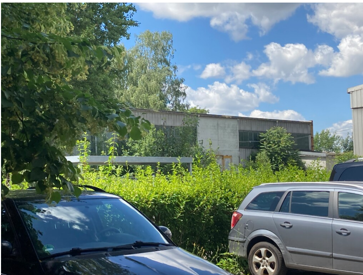
Blick auf die westliche Traufseite der Mehrzweckhalle