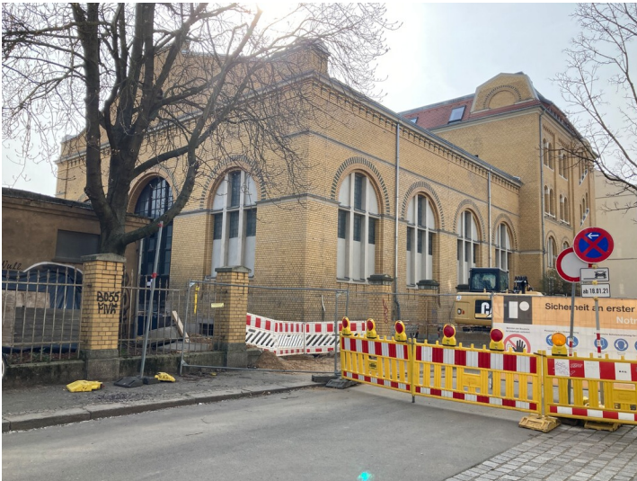
Kesselhaus aus nördöstlicher Richtung