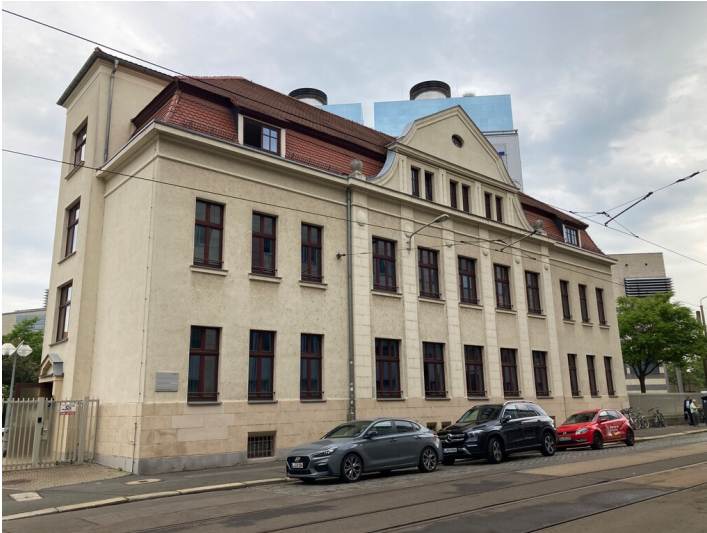
aus südwestlicher Richtung