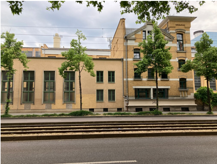
ehemaliges Accumulatorenhaus mit Anbau auf Nordseite, aus westlicher Richtung