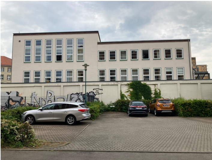
südliche Traufseite des südlichen Gebäudeflügels