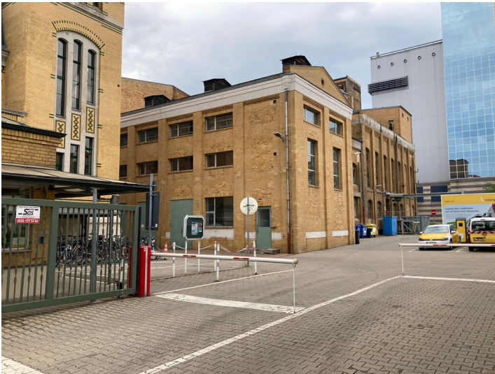
südwestliche Ecke des Maschinen- und Kesselhauses