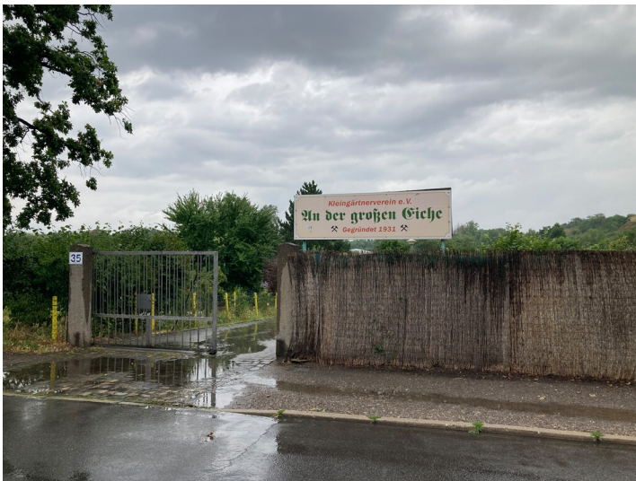
Eingang zu Gartenanlage an der Leinestraße, Blick Richtung Nord