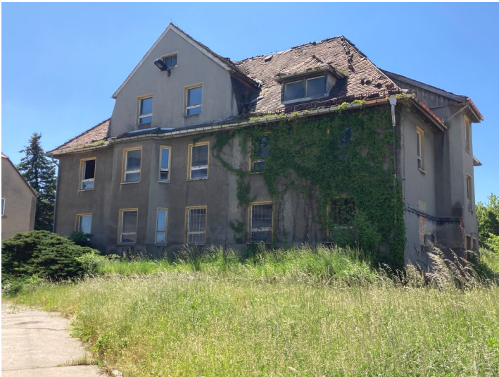
Blick auf die westliche Traufseite