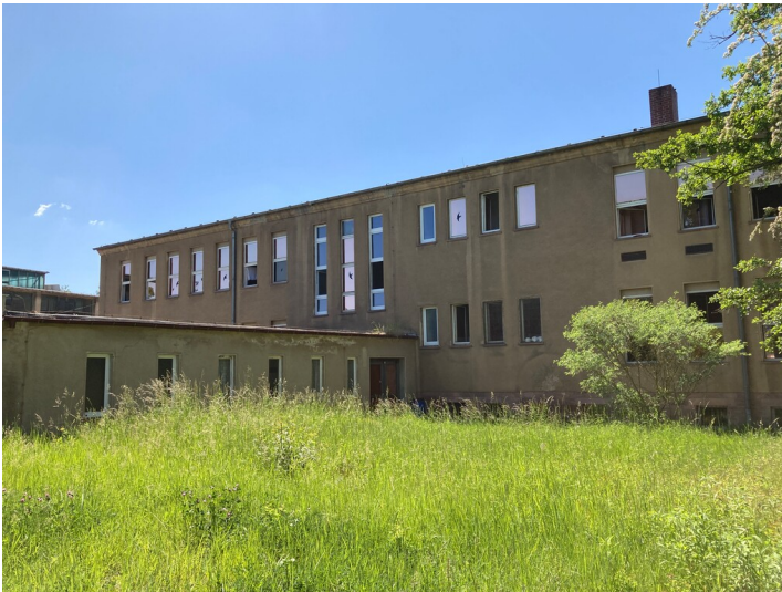
Gebäuderückseite mit Anbau aus nordwestlicher Richtung