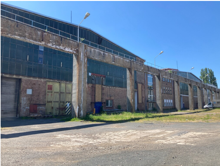
nördliche Giebelseite der beiden Fabrikhalle mit der davor platzierten Freikrananlage, Blick Richtung Südwest