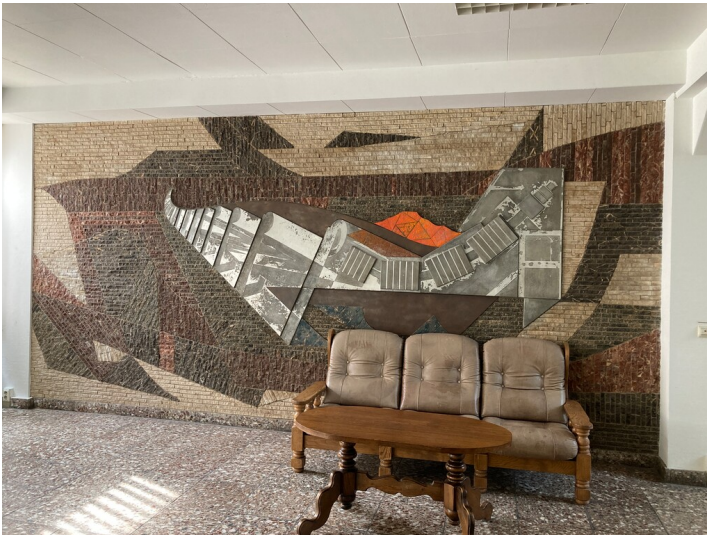
Wandbild im Foyer des Büro- und Sozialgebäudes des VEB Montan Fotograf/Urheber: Isabell Schmock-Wieczorek