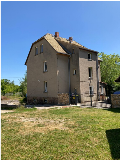
Blick aus nordwestlicher Richtung