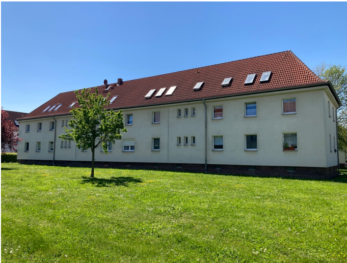
Mehrfamilienwohnhaus der Siedlung, rückwärtige Ansicht