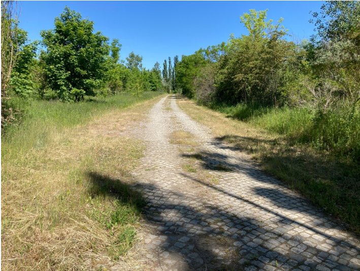
historische Werkstraße nördlich des Geländes der Zentralwerkstatt (Bereich der ersten Brikettfabrik)