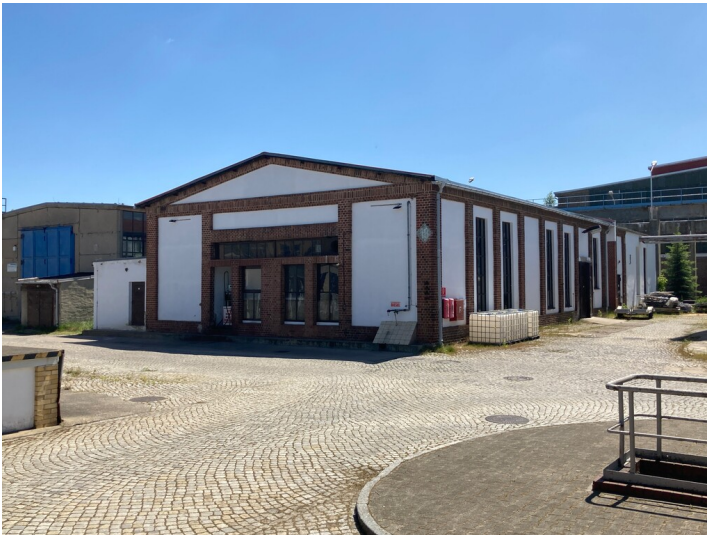
Blick auf die nordwestliche Gebäudeecke des westlichen Flügels