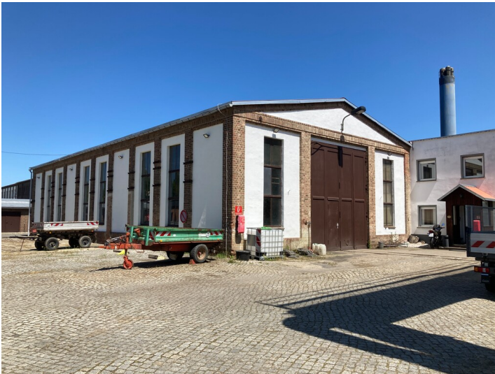
Blick auf die südwestliche Gebäudeecke