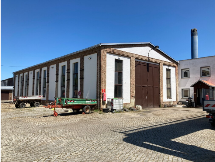
Blick auf die südwestliche Gebäudeecke