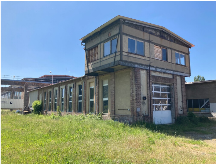
Blick auf die nordöstliche Gebäudeecke