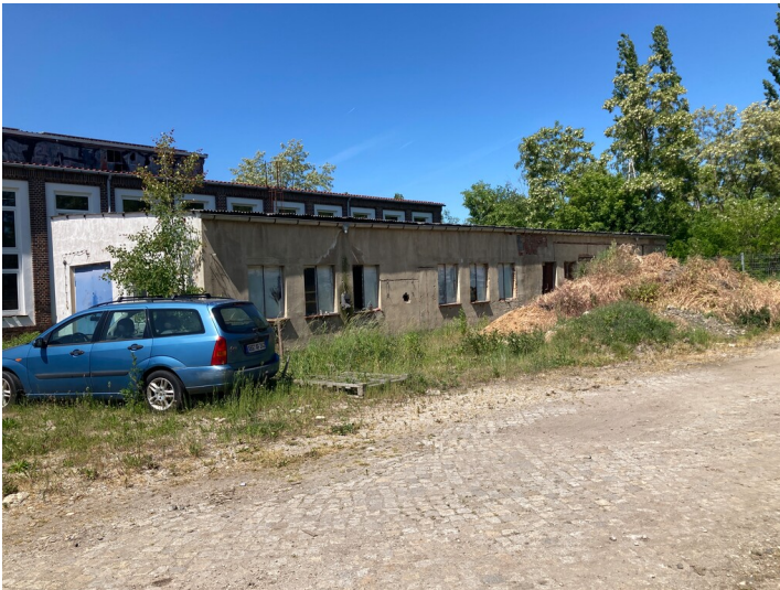
Aufnahme mit Blick in nordwestliche Richtung