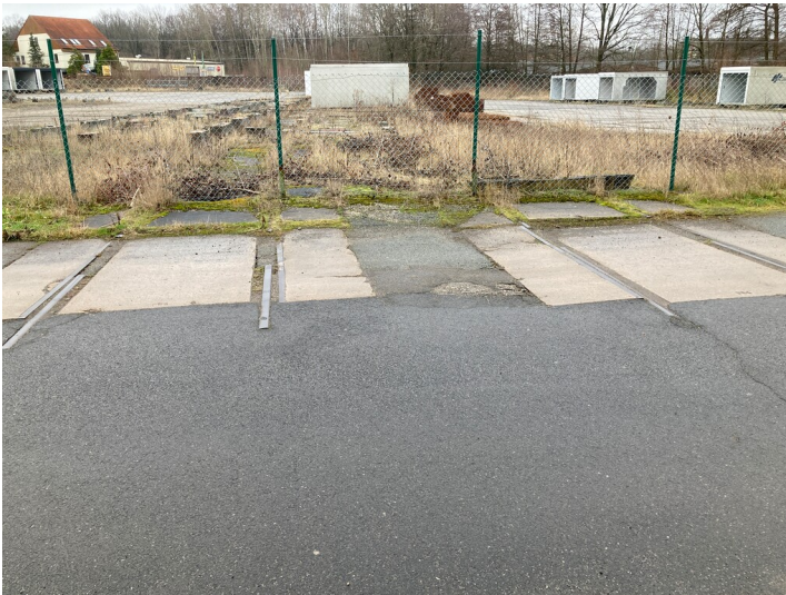
Gleisreste im Bereich der Brandiser Tonwerke/Waldbadweg, Blick Richtung Ost