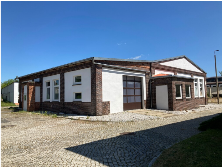
Blick auf die südöstliche Gebäudeecke