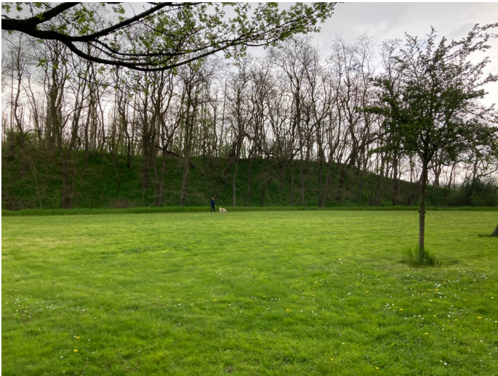
Blick Richtung Nordwest