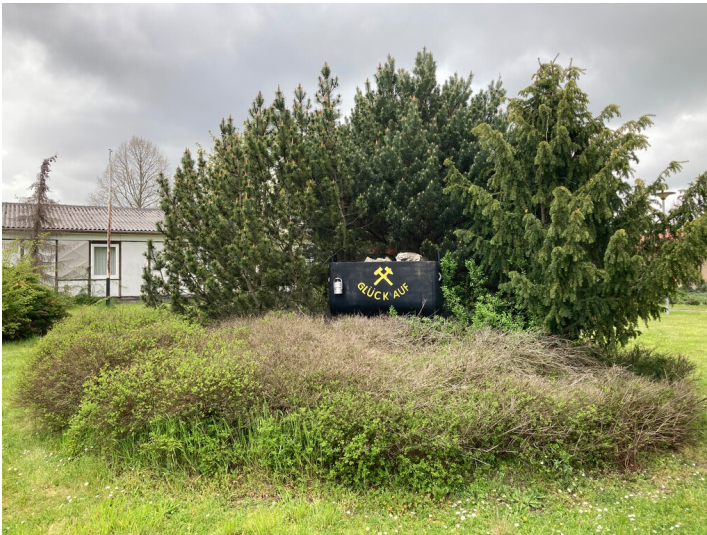
mit Blick Richtung Norden