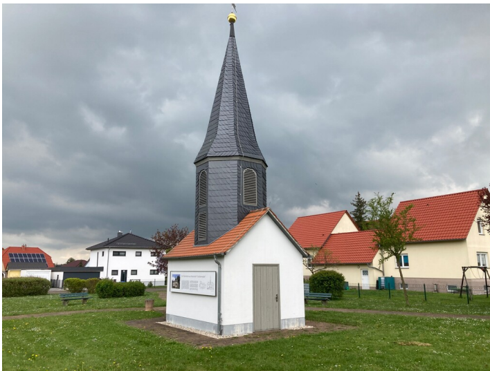
Blick aus westlicher Richtung