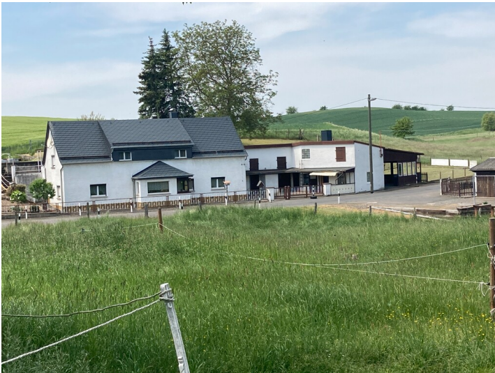
Wohnhaus und Verwaltungsgebäude aus östlicher Richtung