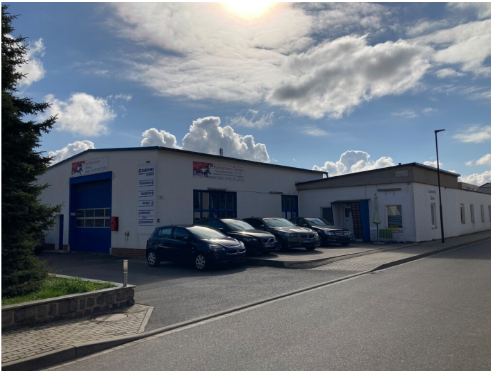
Lager und Werkstatt aus nördlicher Richtung