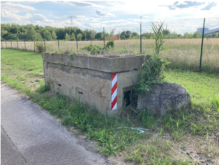
Splitterschutzbunker aus nördlicher Richtung