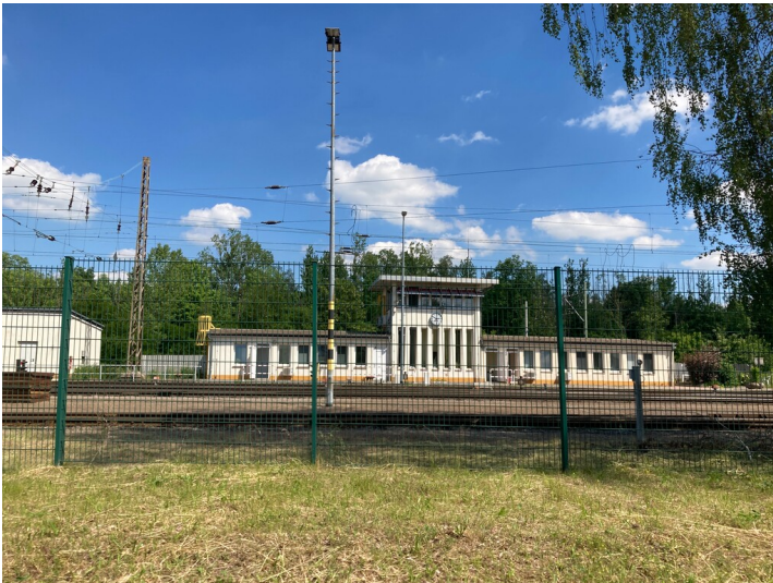
Stellwerk und Relaisraum aus westlicher Richtung