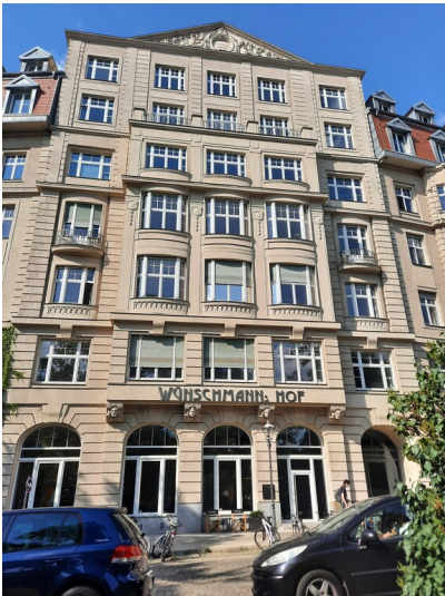
Sitz des PKM-Büros auf der Südseite

Schlagwörter: Bürogebäude Fachsicht(en): Denkmalpflege Gemeinde(n): Leipzig Kreis(e): Leipzig Bundesland: Sachsen