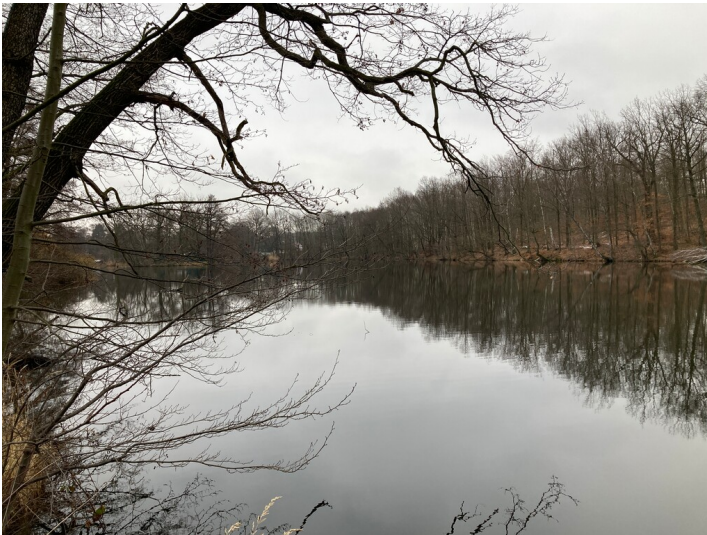
Schachtloch vom nördlichen Ufer