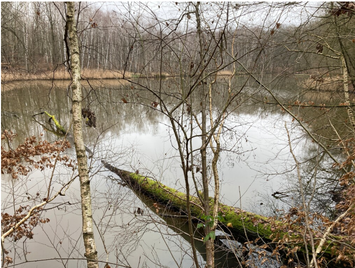
Kohlenteich aus nördlicher Richtung