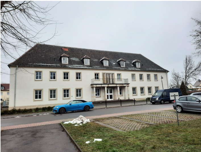
Kinderwochenheim aus westlicher Richtung