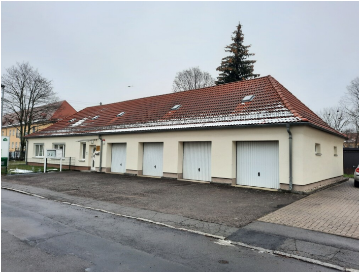
Lager- und Garagengebäude mit Blick nach Nordost