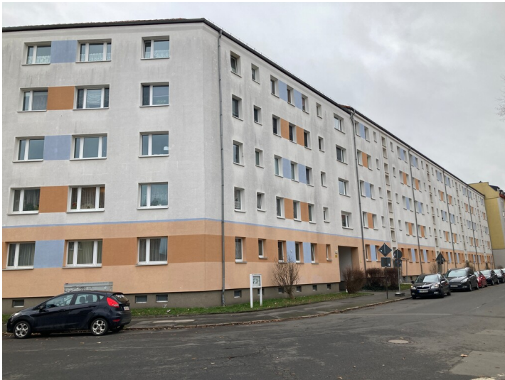
Blockrandbebauung an der Rosa-Luxemburg-Straße aus östlicher Richtung