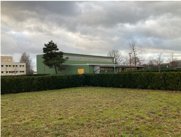
Sporthalle aus nordöstlicher Richtung