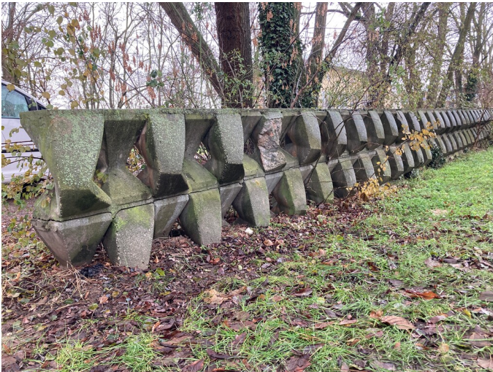
Einfriedung am Kulturhaus aus nordöstlicher Richtung