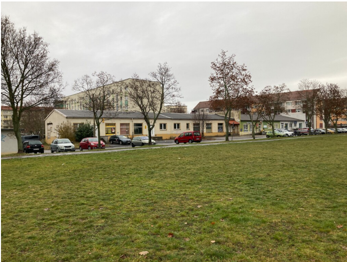
Ladenzeile aus südwestlicher Richtung