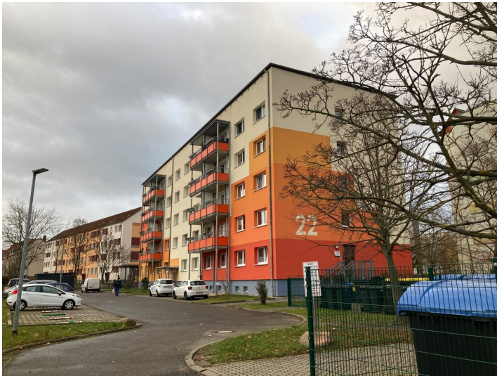
Ledigenwohnheim aus nordöstlicher Richtung