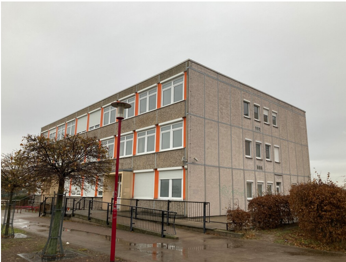
westliche Gebäudeseite aus südwestlicher Richtung