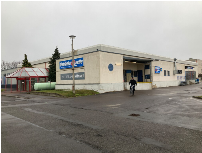
ehemalige Gaststätte mit Blick nach Nordwest