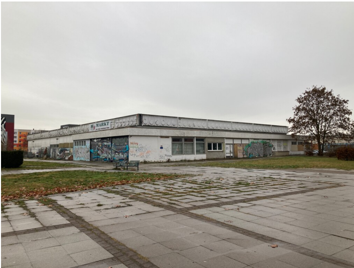
Kaufhalle mit Vorbau aus südöstlicher Richtung