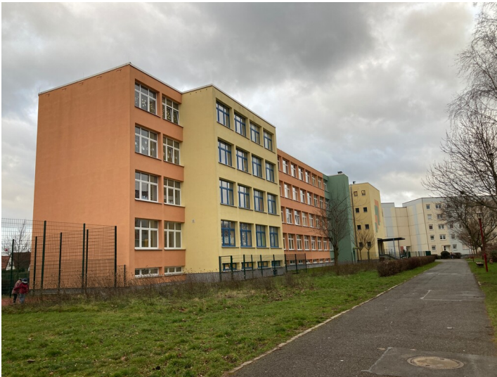
Schule aus nordöstlicher Blickrichtung