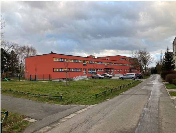
Kindereinrichtung aus nordöstlicher Richtung