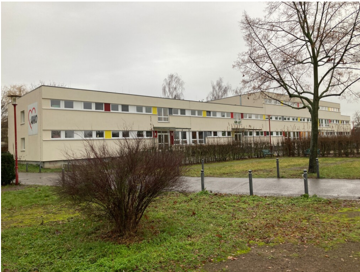
Kinderkombination aus nordöstlicher Richtung