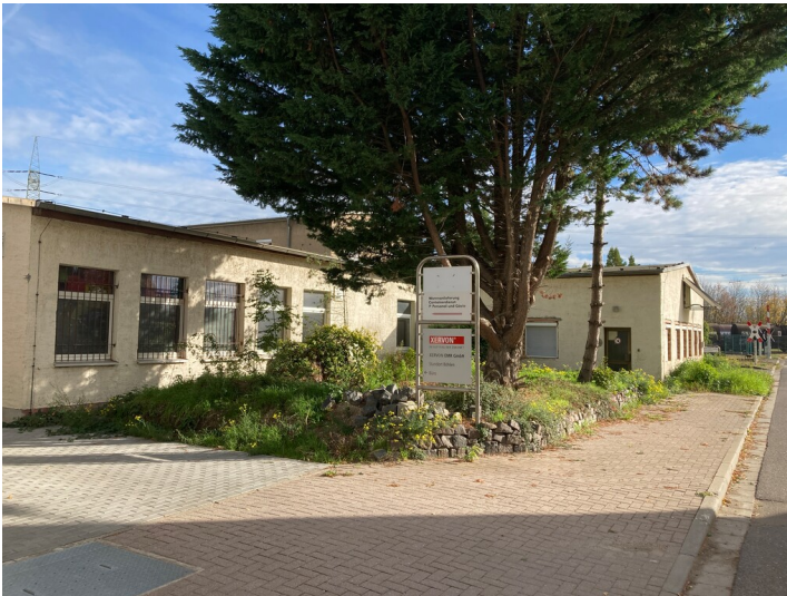
Betriebskantine mit Blick nach Nordost