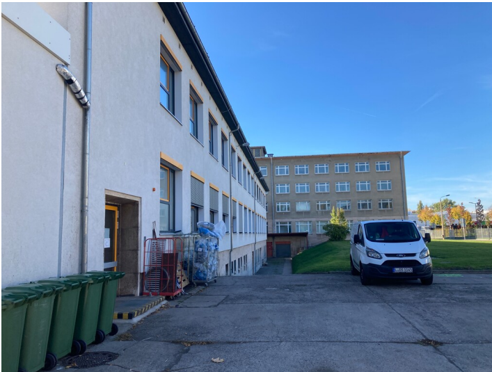
Sozialgebäude aus südöstlicher Richtung