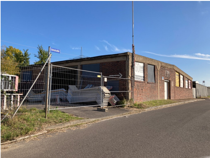
Schuppen mit Blick Richtung Südosten