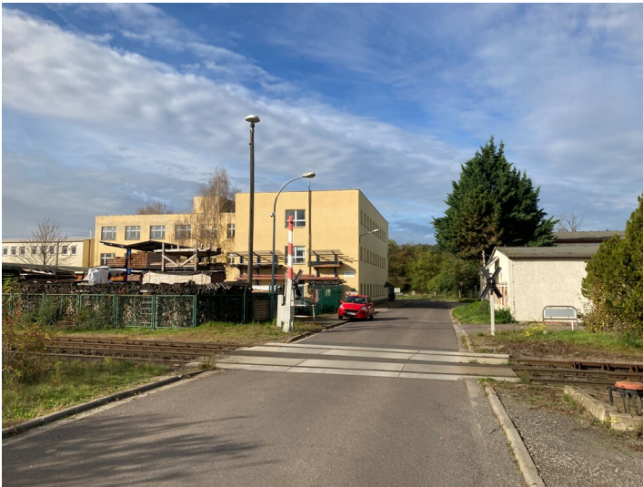
Zimmereigebäude aus östlicher Richtung